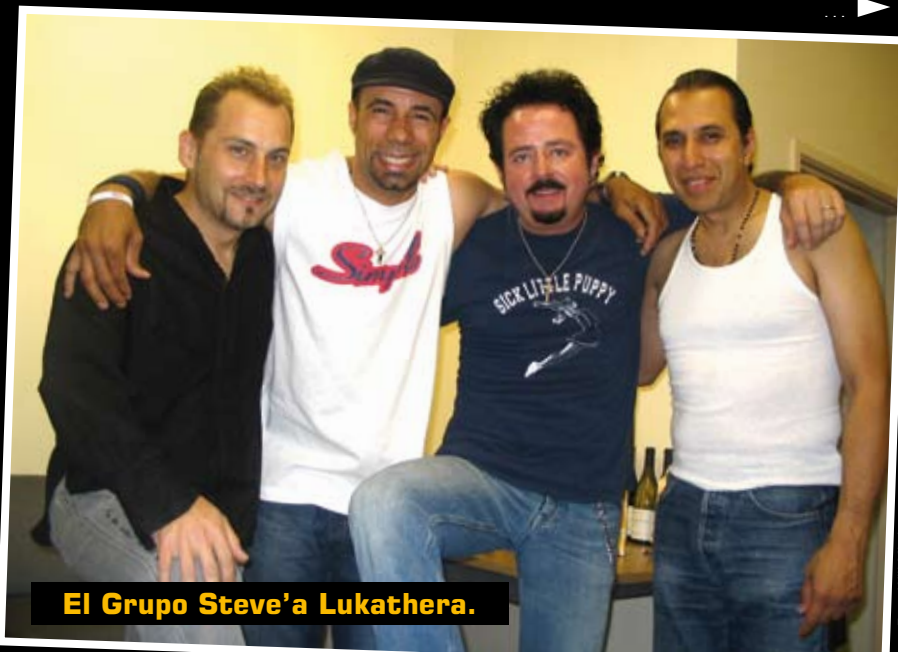
El Grupo Steve'a Lukathera.

To rozumiałe. Jestem przecież głównym graczem w organizacji zwanej TOTO: autorem piosenek, wokalistą, producentem i gitarzystą. Stąd są obecne tutaj, na tym krążku. To styl, w którym piszę. Gdy pisałem z Paichem czy innymi kolegami, miało to trochę inny odcień, ale wciąż było to podobne, bo taki jestem. Próbuje pisać muzykę bez określenia, że to jest dla TOTO, a to nie. Pozwalam utworowi się rozwijać, a gdy już powstanie, nie zadaję sobie pytania. Czy to brzmi jak TOTO? To po prostu część mojego życia. Myślę, że ludzie byłiby raczej wkurzeni, gdy zrobiłbym deathmetalową płytę. Powiedzieliby - co ten koleś wyprawia?! W przeszłości próbowałem wy-